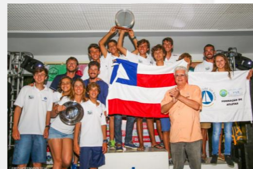
YCB / FENEB - Melhor Clube de Vela Jovem 2016