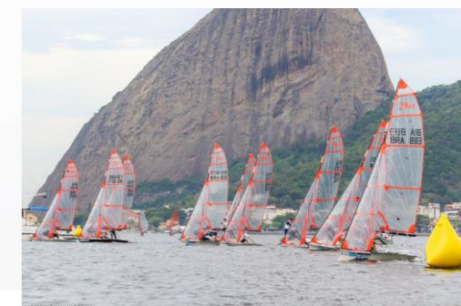
Largada da Classe 29er / Copa da Juventude – ICRJ 2016